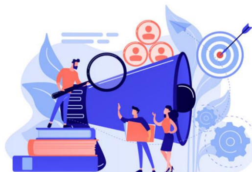
Focus groups in IPAL research