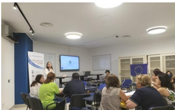
Pilot testing and multiplier events in Italy!