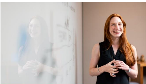
Why knowing how your adult education organisation performs in CPD matters