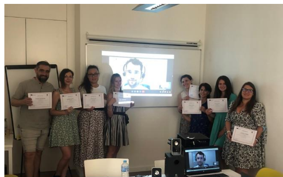
The IPAL meeting in Malaga