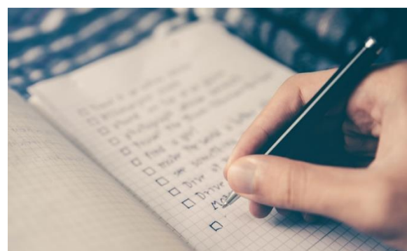
Monitoring of CPD